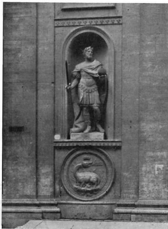
FIG. 2 - ROMA, S. LUIGI DE' FRANCESI - Nicchia di sinistra della facciata (Fot. Min. P. I.).

ronare la volta. Sulla fronte di tale cubo si vede un elegantissimo fascio di palme e di gigli legato in basso da una fascia che serpeggiando chiude ai lati anche rami d'olivo, sui quali pendono due targhe iscritte (fig. 7): in quella di sinistra si leggono le parole: Et foliu eius non defluet in eternu , in quella di destra: Et oia quecunq faciet prosperabitur . In vetta, come un fregio di delfini affrontati.