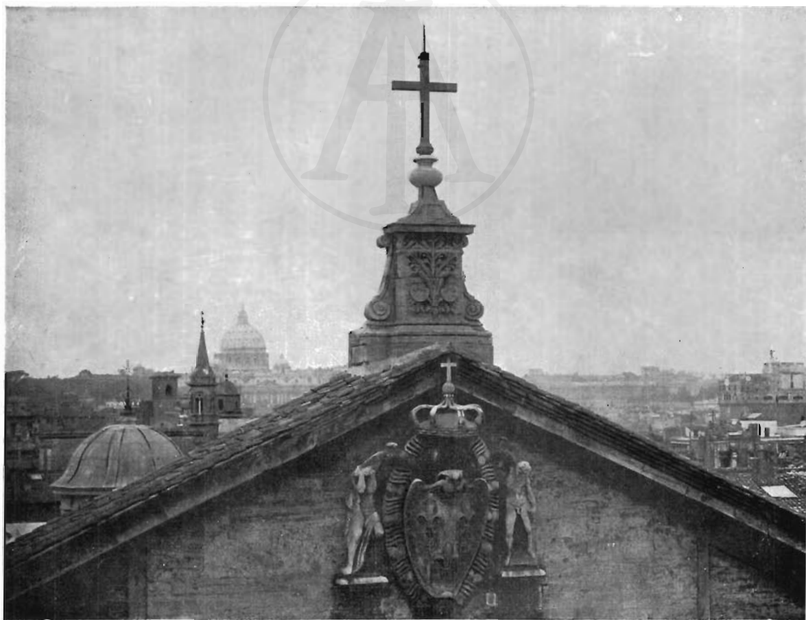
FIG. 6 - ROMA, S. LUIGI DE' FRANCESI - Frontone sulla facciata.