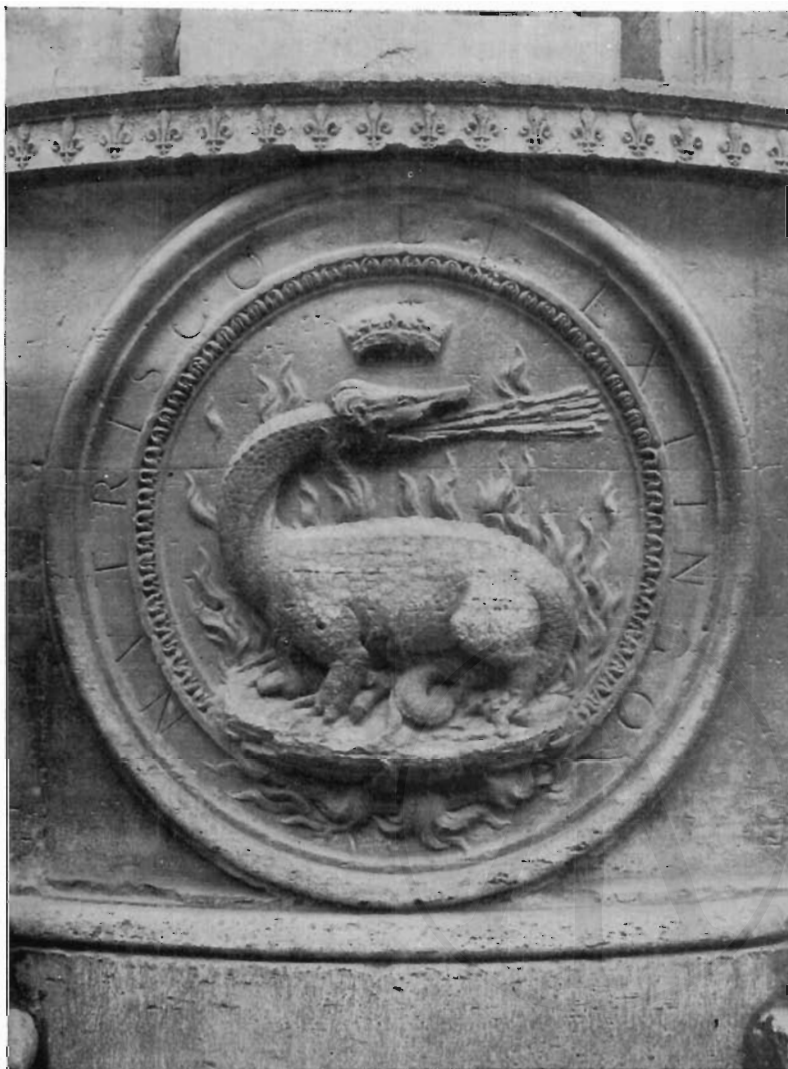
FIG. 4 - ROMA, S. LUIGI DE' FRANCESI - Emblema sulla facciata (Fot. F. Reale).

perché a tale riguardo noi abbiamo elementi sicuri: anzitutto il raggio di m. 2,87 (onde un diametro di 5,70 e una circonferenza di 17,10) definito dalla curva dei due travertini con le salamandre 19) . E che questi appartenessero al basamento lo dice senz'altro il Vasari, che li vide ed esaminò al suo posto.