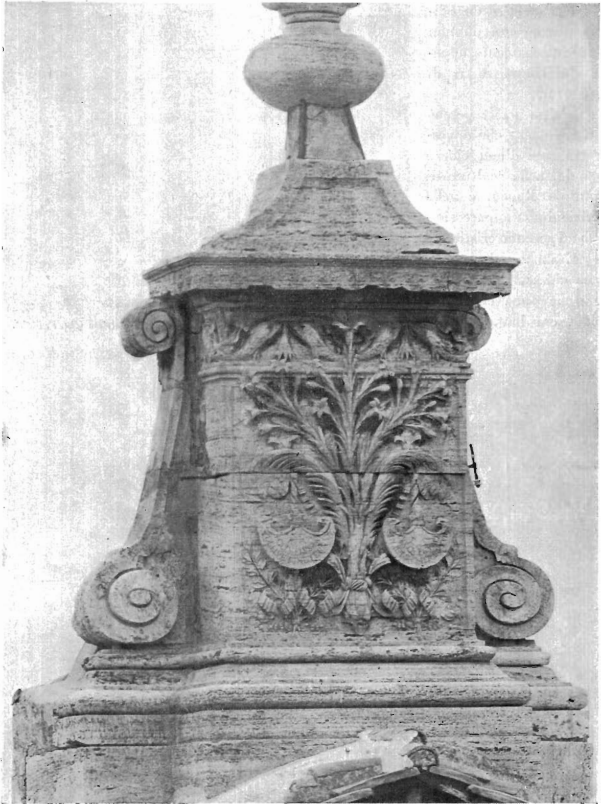
FIG. 7 - ROMA, S. LUIGI DE' FRANCESI - Acroterio terminale sulla facciata.