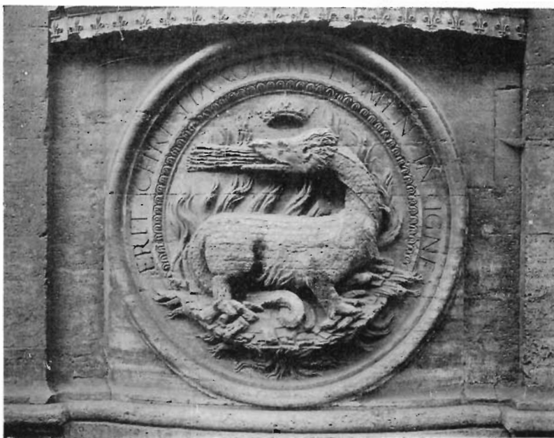
FIG. 5 - ROMA, S. LUIGI DE' FRANCESI - Emblema sulla facciata.

E anche nel caso che fosse chiesa, come sostenere che «una chiesa rotonda era lontana dalle