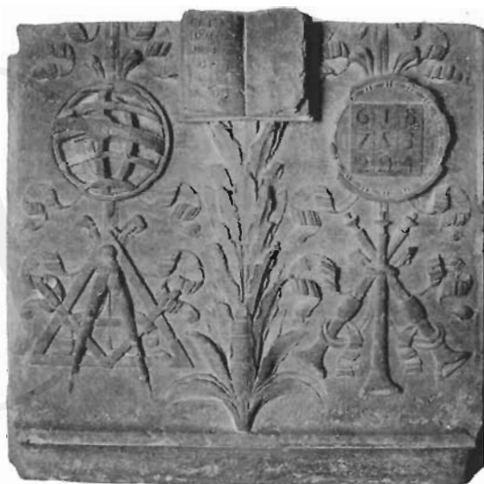
FIG. 1 - ROMA, S. LUIGI DE' FRANCESI - Targa in travertino già sull'angolo del palazzo del Senato.