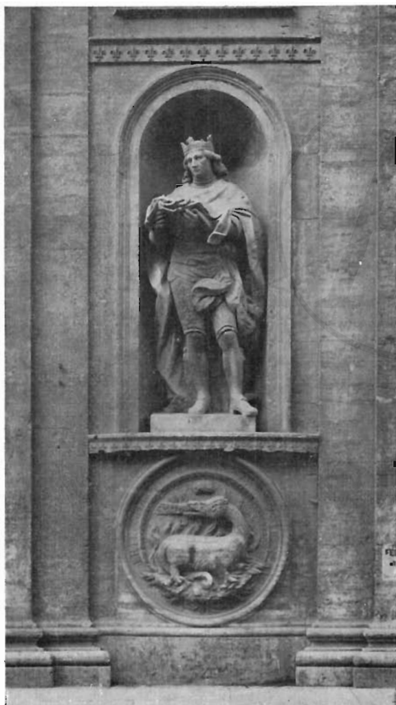
FIG. 3 - ROMA, S. LUIGI DE' FRANCESI - Nicchia di destra della facciata.

Ho già accennato alle protome leonine; ma a tutti i travertini descritti, già ricordati dal Gnoli e dal Mancini, è da aggiungerne un altro finora sfuggito anche a loro, perché confinato sulla cima del frontone della chiesa e messo a reggere la gran croce (fig. 6). È un bellissimo cubo formato da due pezzi e smussato agli angoli, che certo avrebbe dovuto avere, nel tempietto francese, simile destinazione, se pure non a reggere una croce, certo a co-